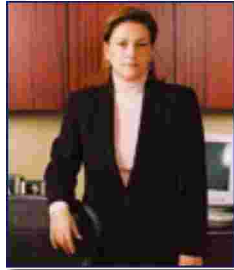
Güler Sabancı Yönetim Kurulu Başkanı Görev Süresi: 17.03.1989 / Mart 2007

Güler Sabancı, T.E.D Ankara Koleji ve daha sonra Boğaziçi Üniversitesi İşletme Bölümü'nden mezun olduktan sonra 1978 yılında çalışma hayatına Lassa Lastik Sanayi A.Ş.'de başlamıştır. Daha sonra 14 yıl Kordsa Kordbezi Sanayi ve Ticaret A.Ş. Genel Müdürlüğü'nü yapmıştır. Aynı dönemde yurt dışında ve içinde bir çok yabancı ortaklı sanayi şirketinin kuruluş ve işletme çalışmalarında görev almıştır.